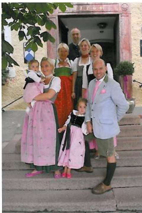
Drei Generationen auf einem Bild: Die Familien Gmachl und Hirnböck

Nach Abschluss der Bauarbeiten im Juli wartet das Romantik Hotel GMACHL mit erweitertem Angebot auf. Ein einzigartiger Wellness- & Spa-Bereich auf über 800 Quadratmetern im Dachgeschoss mit einem unvergleichbaren Blick auf die Salzburger Berge, Hallenbad, Ruhebereich mit offenem Kamin, Saunalandschaft, Beauty-Behandlungsräume und Private Spa für Partnerbehandlungen sind die neuen Highlights. 23 vergrößerte und 17 weitere Zimmer mit rund 35 Quadratmetern, mit Balkon, Terrasse oder Garten laden zum Wohlfühlen ein. Ein vergrößerter Frühstücksbereich erlaubt noch mehr Frühstückerlebnis. Neue, gemütliche Aufenthalts- und Rückzugsbereiche sind ideal zum Arbeiten, Lesen oder Plaudern. Außerdem: Beide Hotelgebäude sind durch einen unterirdischen Gang miteinander verbunden. Mit dem neuen, erweiterten Romantik Hotel GMACHL erfährt Elixhausen eine echte Bereicherung, ein Mehr an Schönerem und Gutem für Gäste und Einheimische gleichermaßen.