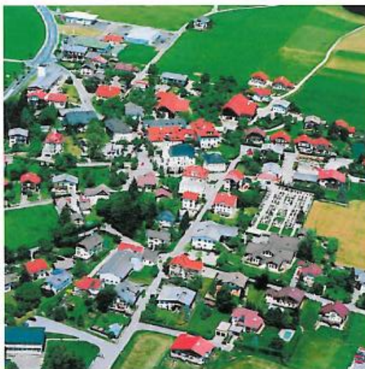
Luftaufnahme von Elixhausen im Jahre 2002.

Gemeinde Elixhausen Schulweg 9 5161 Elixhausen T 0662-480214-0 F 0662-480214-22 gemeinde@elixhausen.at www.elixhausen.at